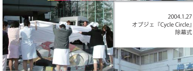
2004.1.27 オブジェ『Cycle Circle』 除幕式