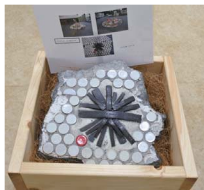
奥様にお返ししたオブジェの一部。 ここでは、制作に関わった方々の名前が刻まれたプレートが貼り付けてあります。

るので、それをまとめて新しいオブジェを制作することにしています。新しい子供達もまた可愛がって頂ければ幸いです。ありがとうございました。